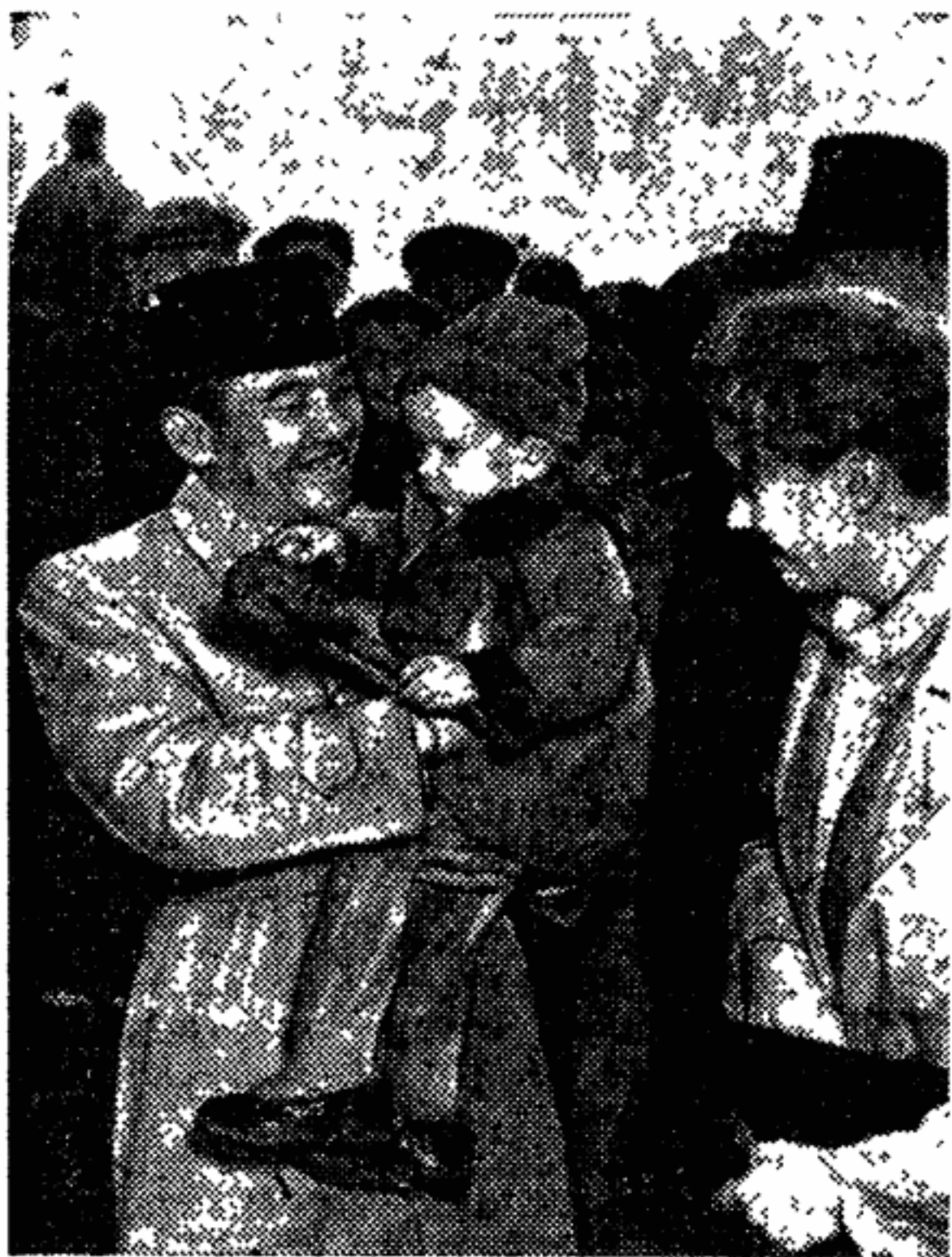
Во время пребывания в Ленинграде Президенту Республики Индонезии Сукарно, как и всюду в нашей стране, был оказан радушиный прием. На снимке: Президент Сукарно среди ленинградцев на площади Декабристов.