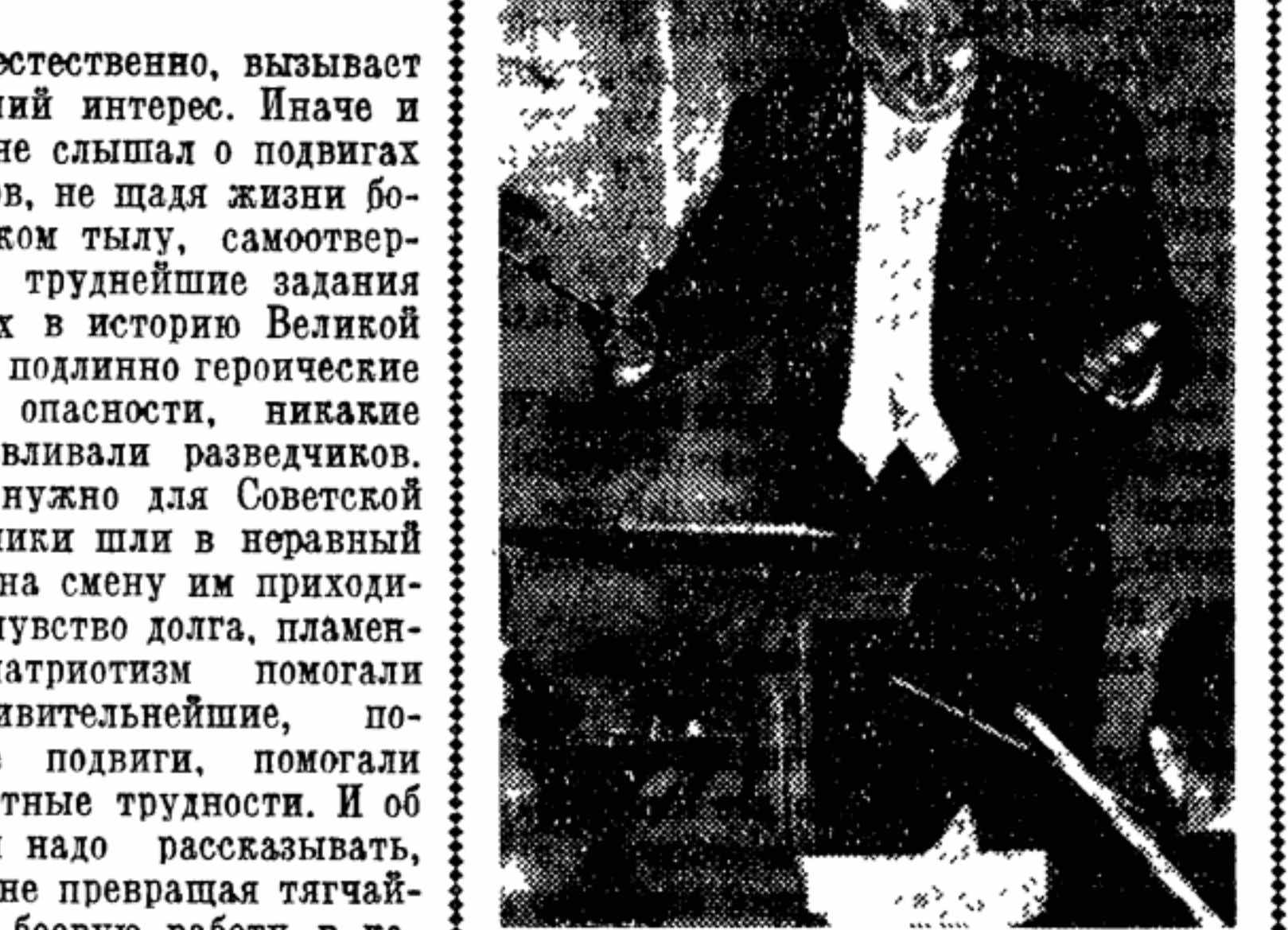
Над эстрадой Большого зала Московского консерватории — составленная из ярких осенних цветов цифра «75». Это — знак приветия гостю, Бостонскому симфоническому оркестру, в дни своего 75-летнего юбилея совершающему большое турне по странам Европы.

Бостонский оркестр — самый многочисленный музыкальный коллектив из тех, что посетили нашу страну за последнее время: более ста первоклассных музыкантов во главе с дирижером Чарльзом Мюншем (руководитель оркестра) и Пьером Монте. И каждый из них — необходим и незаменим в общем на редкость слитном ансамбле. За такими ценнейшими качествами Бостонского оркестра, как его дисциплинированность, сочетающаяся с большой артистической свободой, стоит большой путь, пройденный коллективом, который видел за пультом и Артура Никиша, и Сергея Кусевицкого — выходца из России, в течение четверти века возглавлявшего оркестр, и других выдающихся дирижеров.